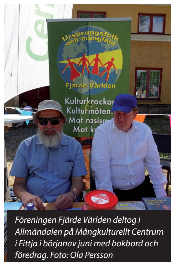
Föreningen Fjärde Världen deltog i Allmändalen på Mångkulturellt Centrum i Fittja i början av juni med bokbord och föredrag.