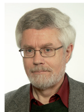
Lennart Rohdin

Regeringen förutskickade i Budgetpropositionen för 2016 en översyn av minoritetslagen och behov av fler förtydliganden kopplade till Sveriges konventionsåtaganden för att säkra de nationella minoriteternas rättigheter. Lagen (2009:724) om nationella minoriteter och minoritetsspråk ger samliga fem nationella minoriteter grundläggande rättigheter i hela landet, däribland rätten till information och delaktighet. Finska, meänkieli och samiska har ett förstärkt skydd i förvaltningsområdena för respektive språk, däribland rätt att använda språken i myndighetskontakter och rätt till barn- och äldreomsorg på språken.