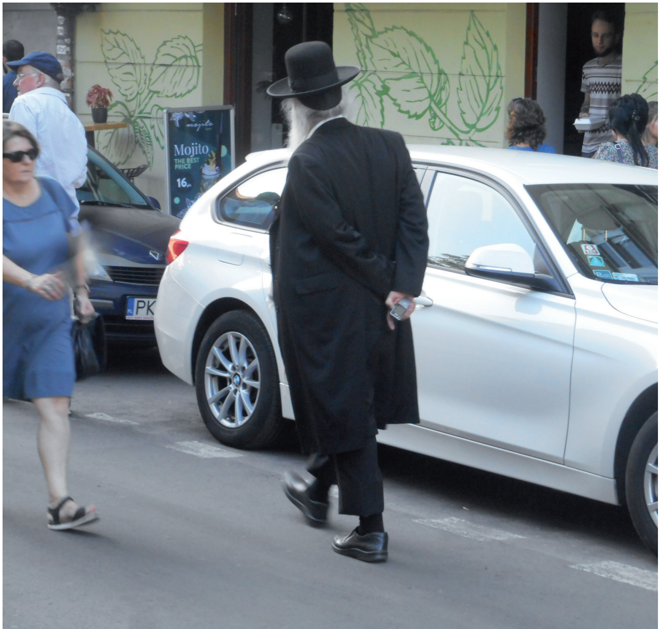
I Krakows gamla judiska kvarter Kazimiers pågår arbete på att återskapa den judiska kultuir som utplånades under andra världskriget.