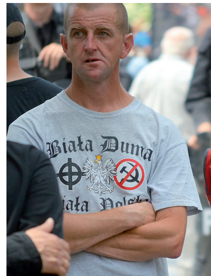
Högerradikal motdemonstrant vid Czestochowas Prideparad, Polen 2018. På t-shirten syns olika symboler: nynazistisk, nationalistisk och antikommunistisk.