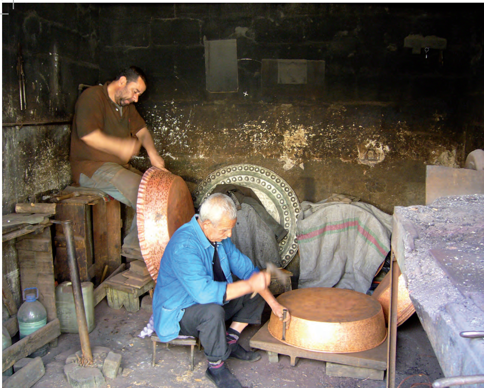
Kopparhantverkare i Constantine.

om Alger är Mohammed Dib. Född och uppvuxen i Bab Eloued, han känner till alla dess hemligheter. För det var i Alger allt hände. Det var i denna urgamla stad som våldet visade sitt allra värsta ansikte. Regeringen tvingades att spela alla sina kort och dess sista var just att svara med våld. Våld mot våld och folket fick betala priset.