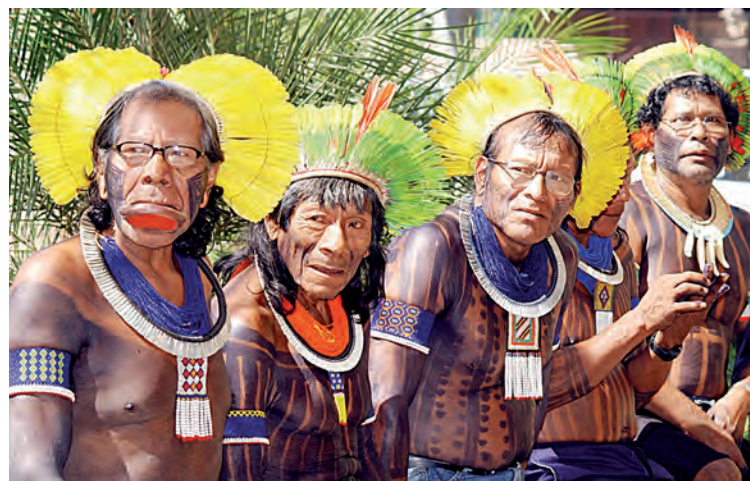
Kayapó-ledare var aktiva på Rio-konferensen.

Vi väntar nu att se resultat av konferensen men i en intervju med utrikesdepartementet säger statsminister Fredrik Reinfeldt att många lär ha känt sig besvikna och frustrerade efter konferensens slut. Vi får alltså vänta och se om något av ovanstående ämnen nämns.