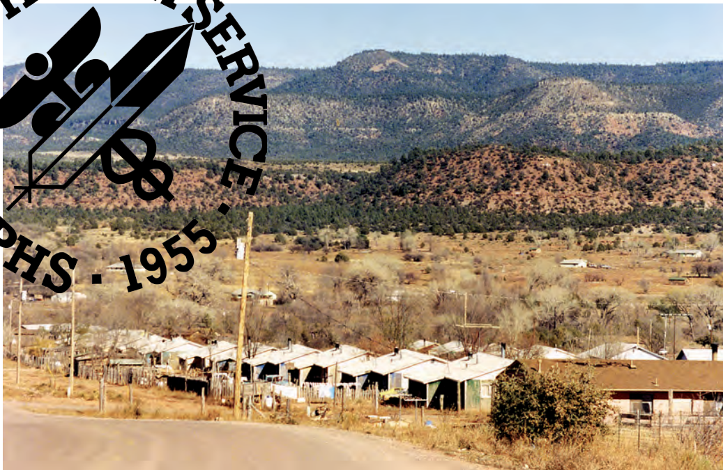
Byn Cibuque på Fort Apache-reservatet i Arizona Över bilden: Indian Health Service logotyp. IHS är det amerikanska federala hälsoprogrammet för amerikanska indianer och urbefolkningar från Alaska.

grepp som anmäls. Fem år senare har man bara gjort 17 arresteringar.