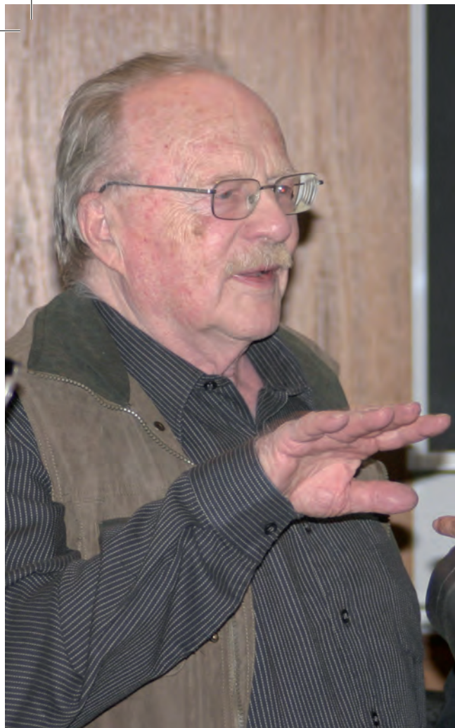
Jan Myrdal, kritiserade rapporteringen om Indien i massmedierna.