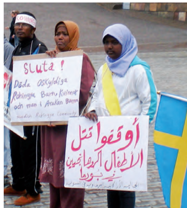
Från en demonstration 17/6 2012 på Mynttorget i Stockholm

Aung San Suu Kyi har all anledning att känna oro för framtiden.