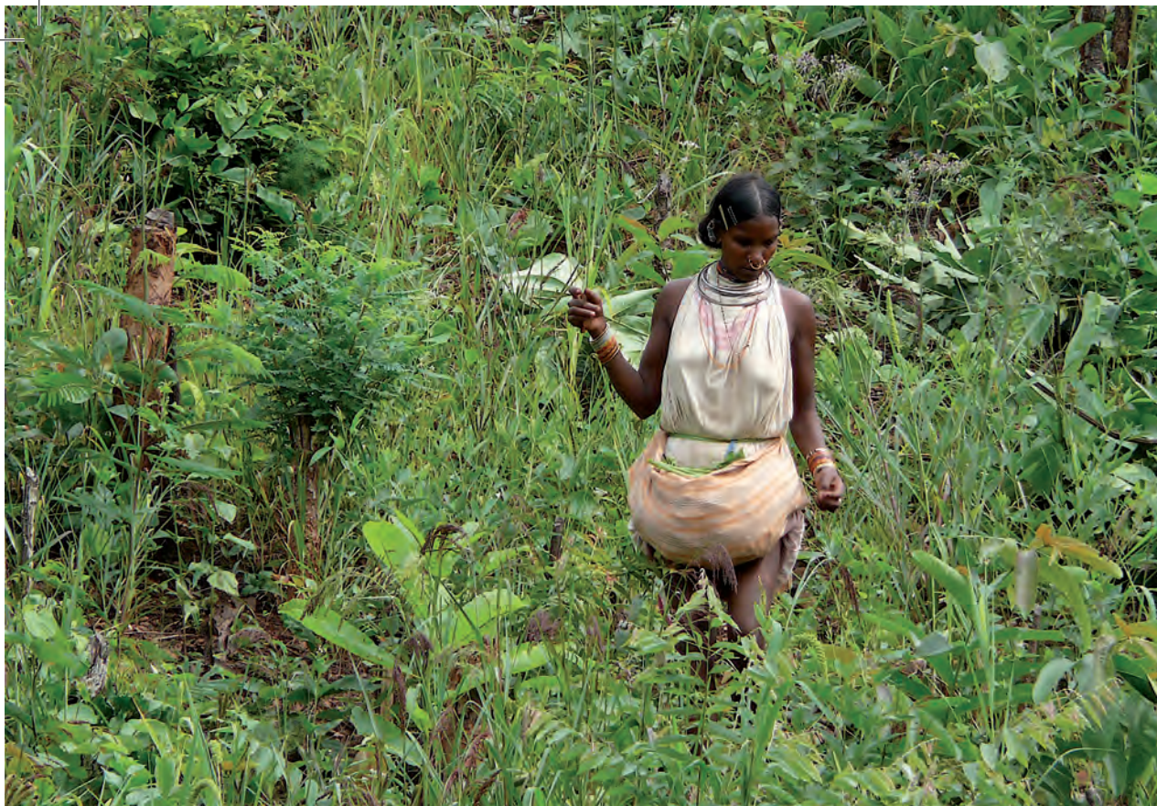
Dongria-folket i Orissa ger inte upp kampen för sina berg.