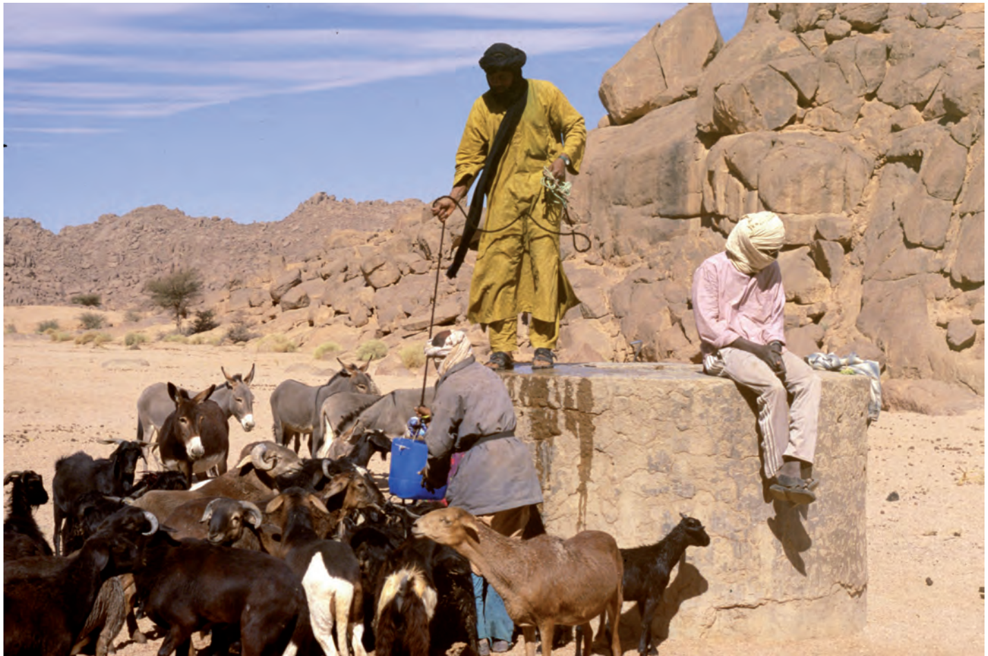
Tuareger i Algeriska Sahara.

ket kräver tusen gånger fler offer? Det skulle naturligtvis vara mycket enklare för oss om vi hade ert flygvapen. Om vi får era bombplan så får ni våra korgar!” (Dialog ur filmen ”Slaget om Alger”)