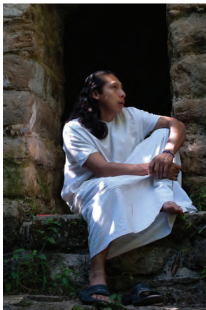
Omslagsbilden: Ur ett bildreportage om lakandonerna, ursprungsfolk i Chiapas, Mexiko.